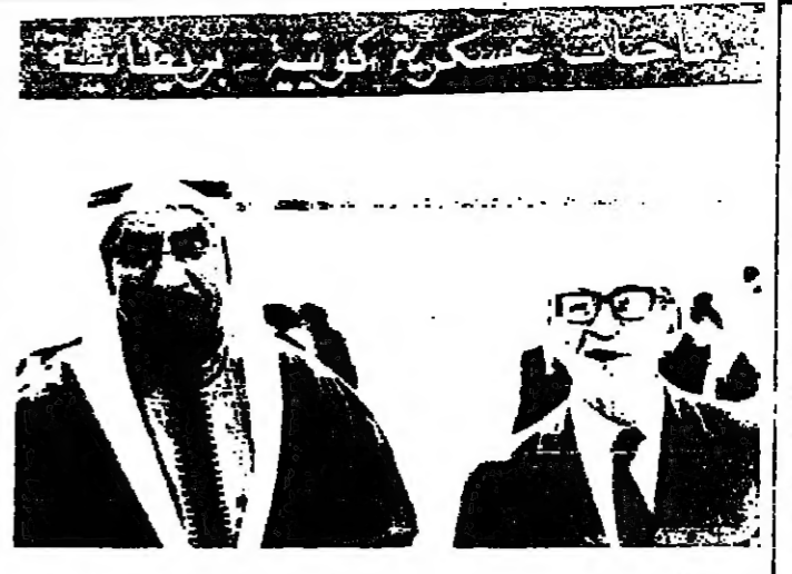
اجتمع الشيخ سعد المبدالله الصباح وزير الداخلية والتماع الكويتي الزائر امس الاول الى فرد مولاي وزير الدفاع البريطاني - وقال ناطق بلسان وزارة الدفاع البريطانية انهما بحثا في شؤون دفاعية ذات اهمية مشتركة ، لكنه امتنع عن الاذلاء بتفاصيل . وفي الصورة يمين الشيخ سعد ومولاي ( صورة بالترتيب من اليمين )

مدير سابق لسكوتلانديارد يعمل في الكويت عيبت الحكومة الكويتية الى روبرت مارك ، وهو مدير سابق بإدارة سكوتلانديارد بهمة وضع خطة لزيارة الكويتية العامة الكويتية - وقد صرح بيلكس امس عبد اللطيف السويدي نائب وزير الداخلية - الكويت - وصف